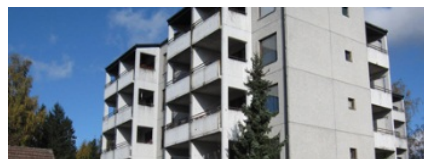
Mäntsälä: Osuustien vanhustentalo