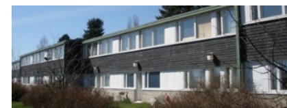
Salo: Hakastaronkatu 15