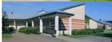
Elimäki ja Korja: Puustelli ry:n Palvelukeskukset