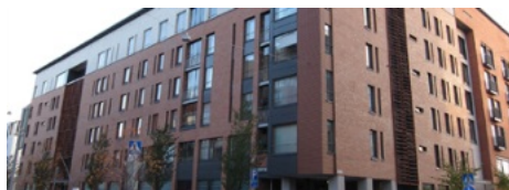
Helsinki: Loppukiri – senioriyhteisö