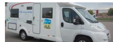
Lappeenranta: Mallu-Palveluauto ja haja-asutusalueen asukkaat